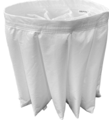
PTFE Filtru PTFE (clasa M EN 60335-2-69)