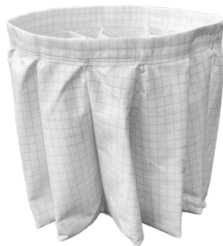
ANT M Filtru antistatic (clasa M EN 60335-2-69)