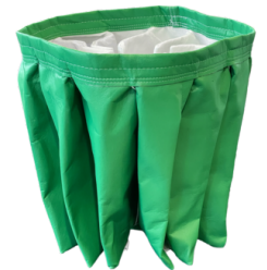
MTF Filtru de teflon (clasa M EN 60335-2-69)