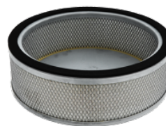
HEPA 14 Filtru absolut (EN 1822) 22.000 cm 2 filter surface H14 Class Filter (EN 1822) Glass fiber