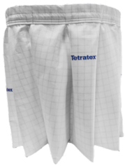
PTFE ANT Filtru antistatic PTFE (clasa M EN 60335-2-69)