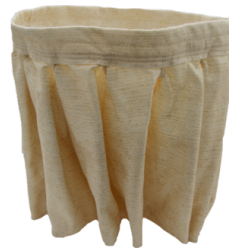
NOMEX Filtru rezistent la 250 ° Celsius