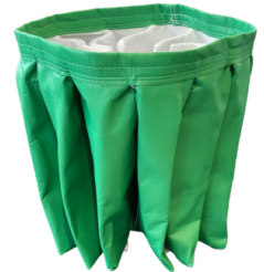
MTF Filtru de teflon (clasa M EN 60335-2-69)