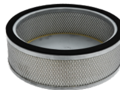
HEPA 14 Filtru absolut (EN 1822) 22.000 cm 2 filter surface H14 Class Filter (EN 1822) Glass fiber