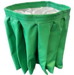
MTF Filtru de teflon (clasa M EN 60335-2-69)