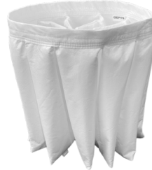
PTFE PTFE Filter (M Klasse EN 60335-2-69)