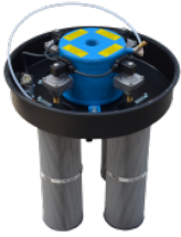
SP Druckluftabreinigung Antistatischer M Klasse Filter (EN 60335-2-69), 4 Polyester Filterpatrone, 12 m 2 Filterfläche