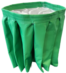
MTF Teflon Filter (M Klasse EN 60335-2-69)