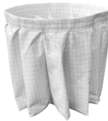
ANT M Antistatischer Filter (M Klasse EN 60335-2-69)