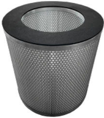
HEPA 14 Absolutfilter (EN 1822) 110.000 cm 2 Filterfläche Antistatischer H14 Klasse Filter (EN 1822) Glasfaser