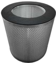
HEPA 14 Absolutfilter (EN 1822) 110.000 cm 2 Filterfläche Antistatischer H14 Klasse Filter (EN 1822) Glasfaser