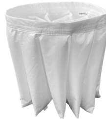
PTFE PTFE Filter (M Klasse EN 60335-2-69)