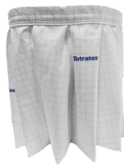
PTFE ANT Antistatischer PTFE Filter (M Klasse EN 60335-2-69)