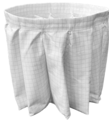
ANT M Antistatischer Filter (M Klasse EN 60335-2-69)