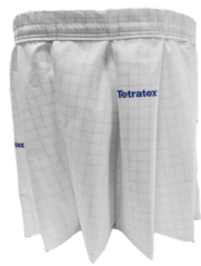
PTFE ANT Filtru antistatic PTFE (clasa M EN 60335-2-69)