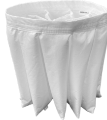
PTFE Filtru PTFE (clasa M EN 60335-2-69)