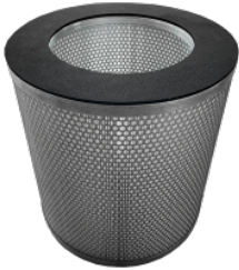
HEPA 14 Filtru absolut (EN 1822) 110.000 cm 2 filter surface H14 Class Filter (EN 1822) Glass fiber