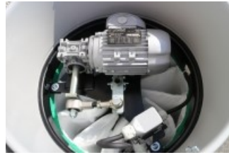
SE Agitator de filtru electric semi-automat