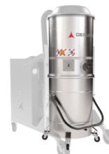
GX Coș și cameră din oțel inoxidabil AISI 304