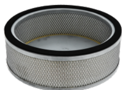
HEPA 14 Filtru absolut (EN 1822) 22.000 cm 2 filter surface H14 Class Filter (EN 1822) Glass fiber