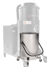
BX Coș din oțel inoxidabil AISI 304