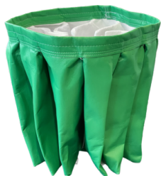
MTF Filtru de teflon (clasa M EN 60335-2-69)