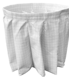
ANT M Filtru antistatic (clasa M EN 60335-2-69)