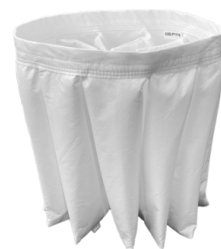
PTFE Filtru PTFE (clasa M EN 60335-2-69)