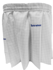
PTFE ANT Filtru antistatic PTFE (clasa M EN 60335-2-69)