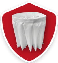
3 JAHRE GARANTIE Beim Kauf des Ersatzfilters zusammen mit dem Sauger