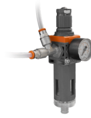
VENTIL FÜR DIE DRUCKLUFTVERSORGUNG