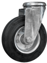
RÄDER Schwenkbares, spurloses Rad