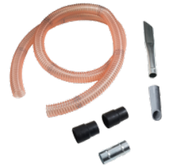
P12352 KIT PRO PENTRU ULEI & SPAN Ø 50MM. Kit de accesorii de bază, diametru de 50 mm, pentru aspiratoarele destinate colectării uleiului și șpanului