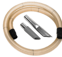
P12351 KIT PRO PENTRU ULEI & SPAN Ø 40MM. Kit de accesorii de bază, diametru de 40 mm, pentru aspiratoarele destinate colectării uleiului și șpanului