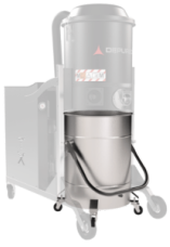
BX Coș din oțel inox AISI 304