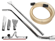
P12355 KIT PRO PENTRU ULEI & SPAN Ø 50MM Kit de accesorii, diametru de 50 mm, pentru aspiratoarele destinate colectării uleiului și șpanului