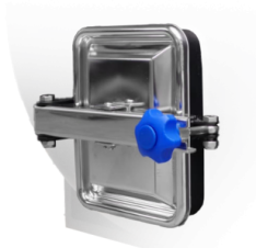
BIS - INSPEKTIONSKLAPPE Klappe für Inspektion und Wartung des Staubsaugers