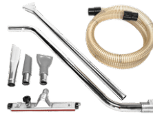
P12354 ÖL UND SPÄNE KIT PRO Ø 40MM Komplett-Kit mit Zubehör für Öl- & Späne- Industriesauger, Durchmesser: 50 mm