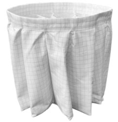
ANT M Filtre antistatique (Classe M EN 60335-2-69)