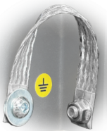
GRD Mise à la terre