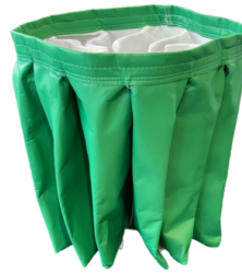
MTF Filtre teflon (Classe M EN 60335-2-69)