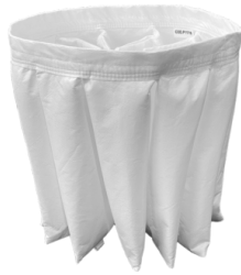
PTFE Filtre PTFE (Classe M EN 60335-2-69)