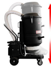
STRUCTURE TÉLESCOPIQUE Pour un gain de place et un transport facile