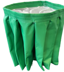
MTF Filtre teflon (Classe M EN 60335-2-69)