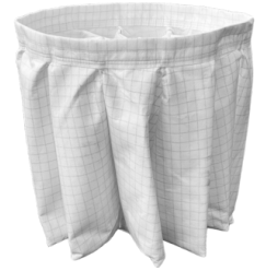
ANT M Filtre antistatique (Classe M EN 60335-2-69)