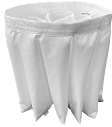
PTFE Filtre PTFE (Classe M EN 60335-2-69)