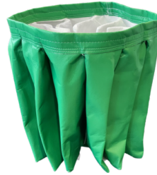
MTF Teflon Filter (M Klasse EN 60335-2-69)