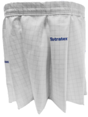
PTFE ANT Antistatischer PTFE Filter (M Klasse EN 60335-2-69)