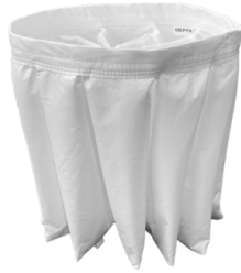
PTFE PTFE Filter (M Klasse EN 60335-2-69)