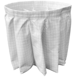
ANT M Antistatischer Filter (M Klasse EN 60335-2-69)