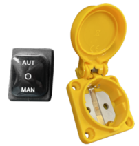
RC SCHUKO Fernbedienung vom Elektrowerkzeug (MAX 2000 W)