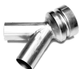
P11717 BIFURCACION «Y» Ø 70/50/50MM

Kit completo de accesorios específicos para la aspiración de polvo y sólidos de 50 mm de diámetro