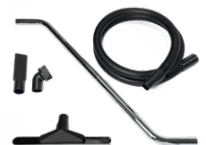
P13639 KIT WET & DRY Ø 40MM Kit completo de accesorios específicos para la aspiración de sólidos y líquidos de 40 mm de diámetro