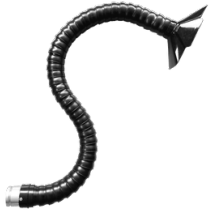
P13970 BRAZO DE ASPIRACIÓN ARTICULADO D70 Brazo de aspiración flexible de PVC para instalación en modelos existentes - 1,2 m de longitud - d70