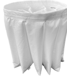
PTFE Filtro PTFE (M clase EN 60335-2-69)