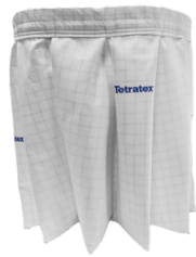
PTFE ANT Filtro antiestático PTFE (M clase EN 60335-2-69)