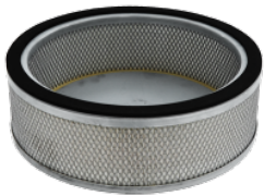
HEPA 14 Filtro absoluto (EN 1822) 28.000 cm 2 superficie filtrante Filtro antiestático clase H14 (EN 1822) Fibra de vidrio