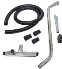
P12348 KIT POUSSIERE Ø 50MM Kit complet d'accessoires spécifiques pour l'aspiration de poussières et de solides de 50 mm de diamètre