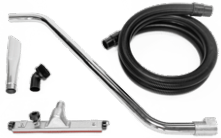
P11887 KIT WET & DRY Ø 50MM Kit complet d'accessoires spécifiques pour l'aspiration de solides et de liquides de 50 mm de diamètre