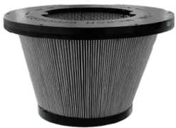
HEPA 13 Absolutfilter (EN 1822) 35.000 cm 2 Filterfläche Antistatischer H13 Klasse Filter (EN 1822) Glasfaser