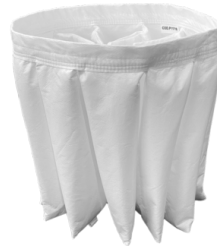
PTFE PTFE Filter (M Klasse EN 60335-2-69)