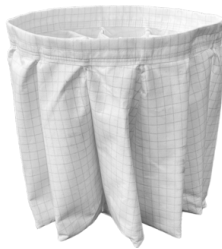
ANT M Antistatischer Filter (M Klasse EN 60335-2-69)