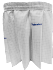
PTFE ANT Antistatischer PTFE Filter (M Klasse EN 60335-2-69)