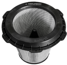
HEPA 13 Filtru absolut (EN 1822) 35.000 cm 2 filter surface H13 Class Filter (EN 1822) Glass fiber