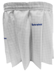
PTFE ANT Filtru antistatic PTFE (clasa M EN 60335-2-69)