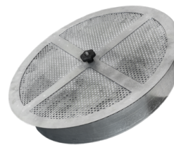
ACB Filtru de carbon activ