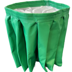
MTF Filtro Teflon (M clase EN 60335-2-69)