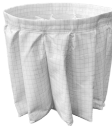
ANT M Filtro antiestático (M clase EN 60335-2-69)