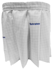
PTFE ANT Filtro antiestático PTFE (M clase EN 60335-2-69)