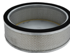
HEPA 14 Filtro absoluto (EN 1822) 22.000 cm 2 superficie filtrante Filtro antiestático clase H14 (EN 1822) Fibra de vidrio