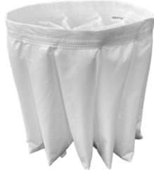
PTFE Filtro PTFE (M clase EN 60335-2-69)