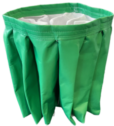
MTF Filtro Teflon (M clase EN 60335-2-69)