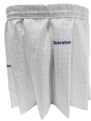
PTFE ANT Filtro antiestático PTFE (M clase EN 60335-2-69)