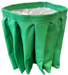
MTF Filtro Teflon (M clase EN 60335-2-69)