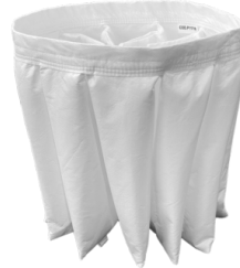
PTFE Filtro PTFE (M clase EN 60335-2-69)