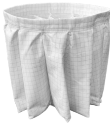
ANT M Filtro antiestático (M clase EN 60335-2-69)