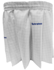
PTFE ANT Filtro antiestático PTFE (M clase EN 60335-2-69)