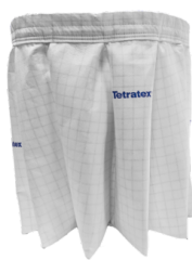
PTFE ANT Filtro antiestático PTFE (M clase EN 60335-2-69)