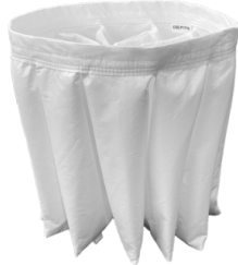
PTFE Filtro PTFE (M clase EN 60335-2-69)