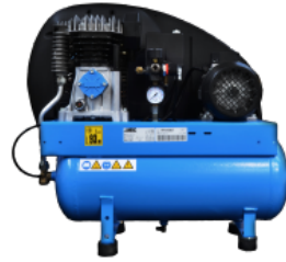
COM Compresor a bordo Compresor instalado por la parte trasera