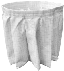
ANT M Filtro antiestático (M clase EN 60335-2-69)