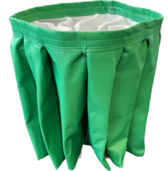
MTF Filtro Teflon (M clase EN 60335-2-69)