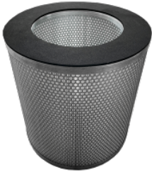
HEPA 14 Filtro absoluto (EN 1822) 110.000 cm 2 superficie filtrante Filtro antiestático clase H14 (EN 1822) Fibra de vidrio