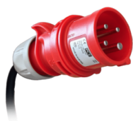
PRISE Prise industrielle à 4 broches