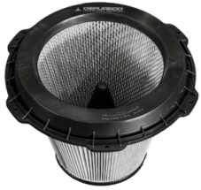
HEPA 13 Absolutfilter (EN 1822) 35.000 cm 2 Filterfläche Antistatischer H13 Klasse Filter (EN 1822) Glasfaser