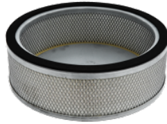
HEPA 14 Absolutfilter (EN 1822) 22.000 cm 2 Filterfläche Antistatischer H14 Klasse Filter (EN 1822) Glasfaser