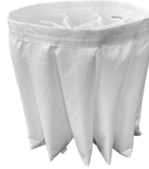
PTFE PTFE Filter (M Klasse EN 60335-2-69)