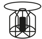
FLT Flotador para líquidos