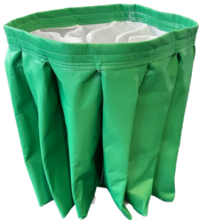
MTF Filtro Teflon (M clase EN 60335-2-69)