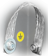
GRD Puesta a tierra