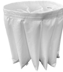
PTFE Filtro PTFE (M clase EN 60335-2-69)