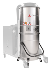
GX Cámara y contenedor en acero INOX AISI 304á