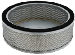
HEPA 14 Filtro absoluto (EN 1822) 22.000 cm 2 superficie filtrante Filtro antiestático clase H14 (EN 1822) Fibra de vidrio