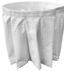
ANT M Filtro antiestático (M clase EN 60335-2-69)