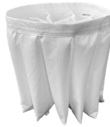
PTFE Filtro PTFE (M clase EN 60335-2-69)