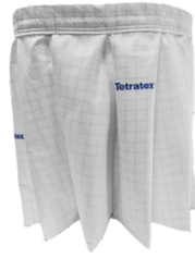
PTFE ANT Filtro antiestático PTFE (M clase EN 60335-2-69)