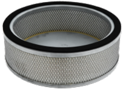
HEPA 14 Filtro absoluto (EN 1822) 22.000 cm 2 superficie filtrante Filtro antiestático clase H14 (EN 1822) Fibra de vidrio