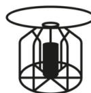
FLT Flotador para líquidos