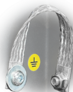
GRD Puesta a tierra