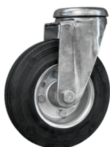
RUEDAS Ruedas pivotantes que no dejan marcas