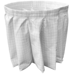
ANT M Filtru antistatic (clasa M EN 60335-2-69)