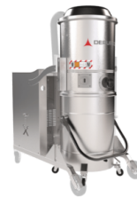
TX Coș, cameră și cadru din oțel inoxidabil AISI 304