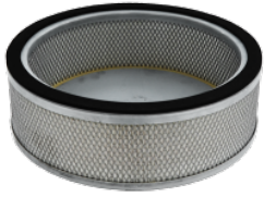
HEPA 14 Filtru absolut (EN 1822) 22.000 cm 2 filter surface H14 Class Filter (EN 1822) Glass fiber