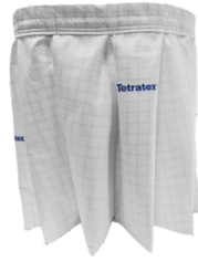
PTFE ANT Filtru antistatic PTFE (clasa M EN 60335-2-69)