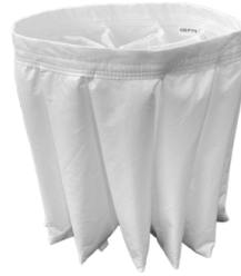
PTFE Filtru PTFE (clasa M EN 60335-2-69)