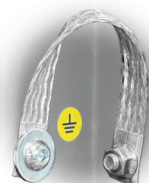
GRD Mise à la terre