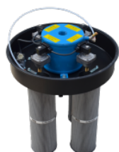
SP Décolmatage cartouches par injection air réseau air comprimé