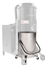
BX Cuve en acier INOX AISI 304