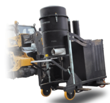
FKL Support levage pour chariot