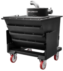
P09319 KIPPBARER VORABSCHIEDER MIT ZYKLONKOPF (580 L)