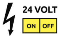
RC Contrôle à distance 24V ON/OFF