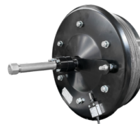
VALVE ANTIDÉFLAGRANTE Soupape qui contient la face de la flamme et la surpression générée par une éventuelle explosion.