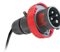
ENCHUFE INDUSTRIAL ATEX DE 4 POLOS

Panel de control eléctrico, implementable con funciones adicionales