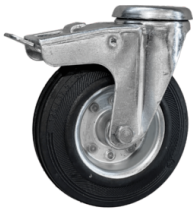
RUEDA CON FRENO