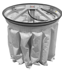
PSC Agitator cu filtru pneumatic semi-automat