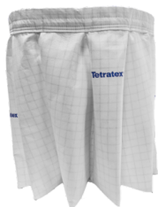
PTFE ANT Filtru antistatic PTFE (clasa M EN 60335-2-69)