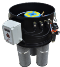
SP Sistem de curățare a filtrului cu jet invers