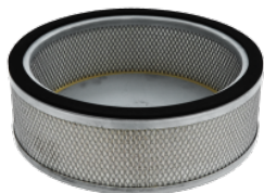
HEPA 14 Filtru absolut (EN 1822) 28.000 cm 2 filter surface H14 Class Filter (EN 1822) Glass fiber