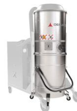
GX Chambre et Cuve en acier INOX AISI 304