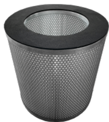
HEPA 14 Filtre absolu (EN 1822) 110.000 cm 2 surface filtrante Filtre antistatique classe H14 (EN 1822) Fibres de verre