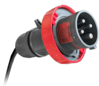
ENCHUFE INDUSTRIAL ATEX DE 4 POLOS

Panel de control eléctrico, implementable con funciones adicionales