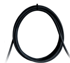
CABLE DE ALIMENTACIÓN

Vacuómetro para señalar cuando el filtro está obstruido o necesita ser sustituido