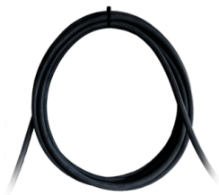
CABLE DE ALIMENTACIÓN

Vacuómetro para señalar cuando el filtro está obstruido o necesita ser sustituido