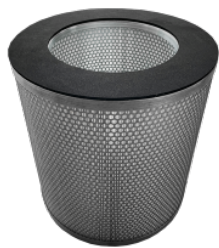
HEPA 14 Filtre absolu (EN 1822) 110.000 cm 2 surface filtrante Filtre antistatique classe H14 (EN 1822) Fibres de verre