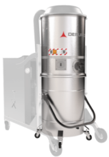
GX Chambre et Cuve en acier INOX AISI 304