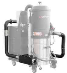
SPARK TRAP Conçu pour capturer les étincelles produites lors du soudage, du meulage ou du polissage de pièces métalliques