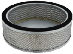
HEPA 14 Filtre absolu (EN 1822) 28.000 cm 2 surface filtrante Filtre antistatique classe H14 (EN 1822) Fibres de verre