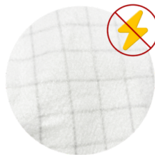
ANTISTATISCHE FILTERUNG Antistatische Filterung zur Ableitung statischer Energie