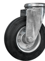
RÄDER Schwenkbares, spurloses Rad