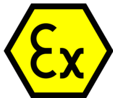
ATEX-ZERTIFIZIERUNG DURCH EINE DRITTE PARTEI