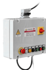
BOÎTIER ÉLECTRIQUE Panneau de commande électrique, pouvant être doté de fonctions supplémentaires