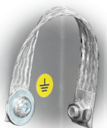
GRD Mise à la terre