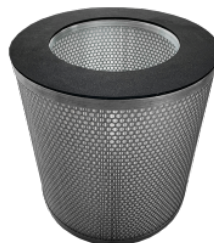
HEPA 14 Absolutfilter (EN 1822)