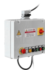
ELEKTRISCHER KASTEN Elektrische Steuertafel, die mit zusätzlichen Funktionen ausgestattet werden kann