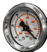
VAKUUMMETER Vakuummeter zur Signalisierung, wenn der Filter verstopft ist oder ausgetauscht werden muss