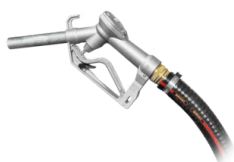
TUBO CON PISTOLA DI SCARICO

Cartuccia antiolio per protezione del motore