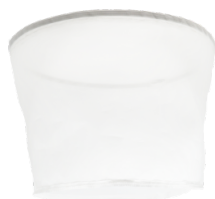
FILTRO LIQUIDI 150μ

Robusta costruzione in acciaio verniciato industriale