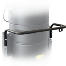
MANIGLIONE DI SPINTA