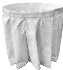
ANT M Antistatischer Filter (M Klasse EN 60335-2-69)