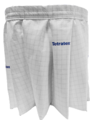
PTFE ANT Filtre PTFE antistatique (Classe M EN 60335-2-69)