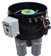
SP Décolmatage cartouches par injection air réseau air comprimé Filtre antistatique classe M (EN 60335-2-69), 3 cartouches polyester antistatique, 9 m 2 surface filtrante