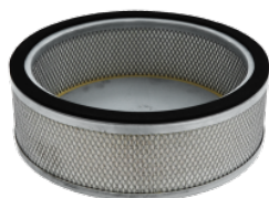
HEPA 14 Filtre absolu (EN 1822) 22.000 cm 2 surface filtrante Filtre antistatique classe H14 (EN 1822) Fibres de verre