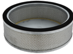
HEPA 14 Filtre absolu (EN 1822) 22.000 cm 2 surface filtrante Filtre antistatique classe H14 (EN 1822) Fibres de verre