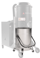
BX Cuve en acier INOX AISI 304