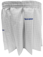
PTFE ANT Filtre PTFE antistatique (Classe M EN 60335-2-69)